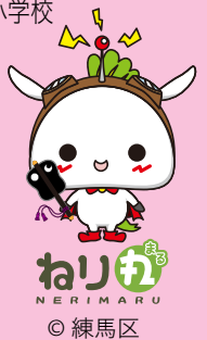
ねり丸 練馬区許諾(非販売)No.30-N-28