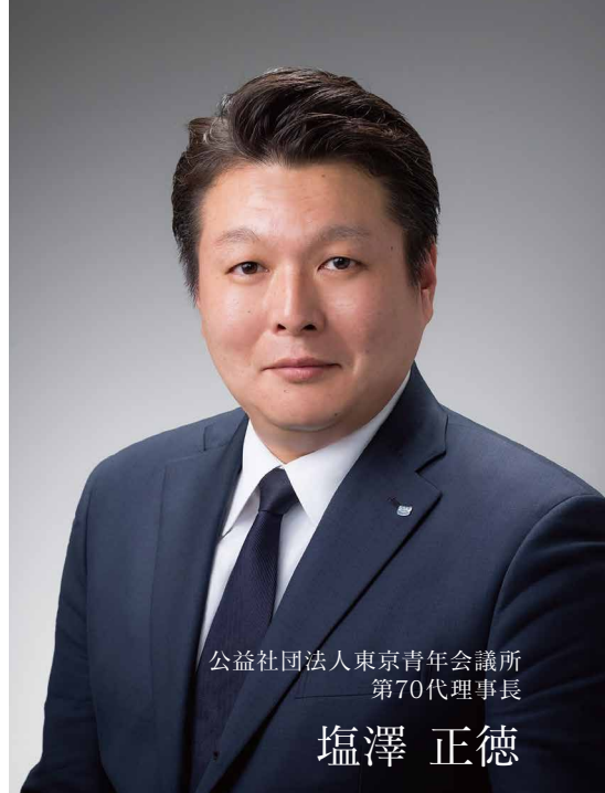
公益社団法人東京青年会議所 第70代理事長

それぞれの市民が自らの本分を理解し、行動に移していくためには何が必要なのか。それは、理想とする像です。現状の課題に飲み込まれ、思考を停止することは成功にせよ失敗にせよ成果に到達することができません。その時に、明確に目指す社会があれば変わるのではないか。設立70周年を迎える我々にとって、東京の中期的なビジョンは不可欠なものでした。その上で、東京2020大会は大きな分岐点となります。青年会議所としては準備段階からどのように、この機会に携わるべきかと考えていましたが、「万国フェス2019」や「東京JC2020パートナーシップ」によってその方向性を確立できたことは一つの成果でありました。私たちが得意とする世界との友情を大いに活用し、この機会に東京23区内の市民と世界とを結び付ける。そして、レガシーとして多文化共生や国際性