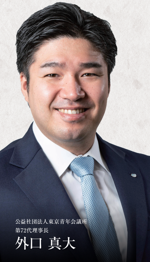
公益社団法人東京青年会議所 第72代理事長

な社会的転換点を現在進行形で迎える中、本年、私たち東京青年会議所は「You can create the world」をスローガンとし、自らの理想を掲げ、理想を実現するための運動を展開してまいります。また東京青年会議所を取り巻く環境も日々変化しております。時代に迎合するのではなく、設立趣意書にある「原点」を守り、時代に即した組織改革を行うことで、さらに時代に求められる組織と進化できるように取り組んでまいります。本年度も変わらぬご支援をいただき、明るい豊かな社会の実現に向け、何卒お力添えをお願い申し上げます。